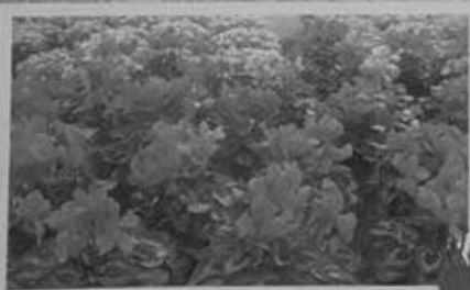
Concimazioni e diserbi Lavorazione e pulizia terreni