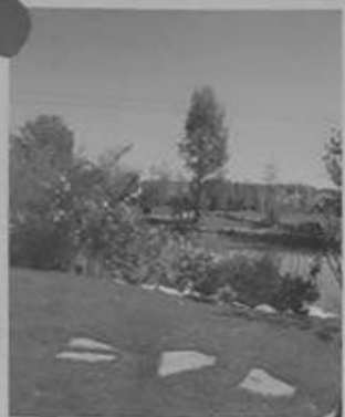
Lavori di potatura anche ad alto fusto

Impianto e cura del verde Creazione di giardini e terrazzi