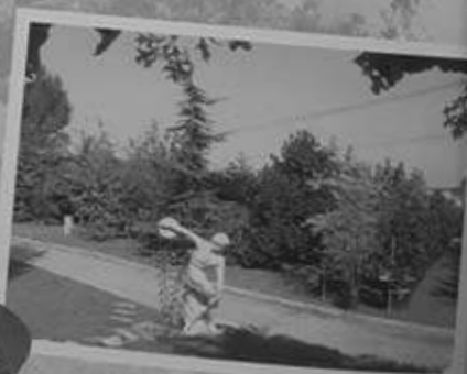
Impianti di irrigazione

LIGNANA - Strada delle Grange - Tel. 0161 314269 www.floricolturaviaro.it - floricoltura.viaro@libero.it