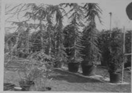
Semina o trapianto prato a rotoli e cura tappeti erbosi